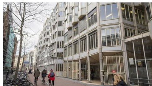
PC Hoofthuis, UvA, Spuistraat 134, het adres van het NGNS en de opleiding Nieuwgrieks

Met dank aan de staf van de opleiding Nieuwgrieks en het NGNS-bestuur.